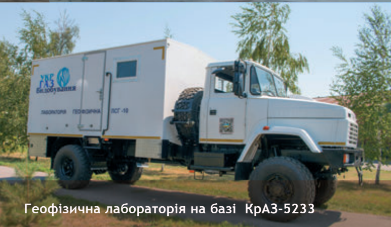
Геофізична лабораторія на базі КраЗ-5233