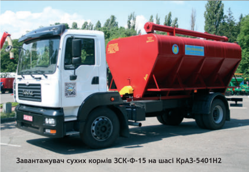
Завантажувач сухих кормів ЗСК-Ф-15 на шасі КраЗ-5401Н2