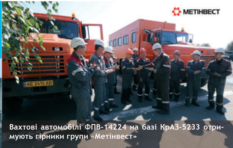
Вахтові автомобілі ФПВ-14224 на базі КраЗ-5233 отримують гірники групи «Метінвест»