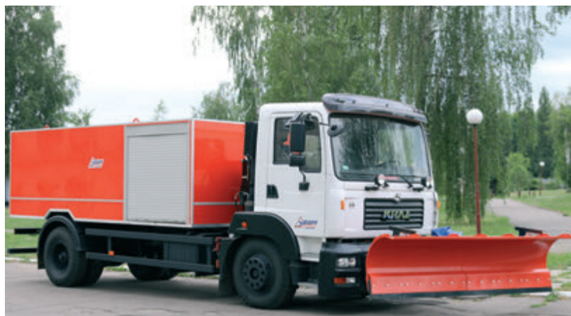
Каналопромивний автомобіль на шасі КраЗ-5401Н2 із відвалом

Крок українського виробника — Кременчуцького автозаводу, у бік зниження ваги своїх вантажівок цілком виправданий, враховуючи те, що комунальний і будівельний сектори потребують мобільну, маневрену і ефективну спецтехніку, призначену спеціально для роботи в міському циклі і на невеликих будівельних майданчиках. Ця тема в дослідно-конструкторських роботах автозаводу одна з найбільш витратних і при цьому — першочергових. Замінити іноземних конкурентів в сегменті мало- і середньотоннажної техніки на внутрішньому ринку — це завдання середньострокової перспективи.