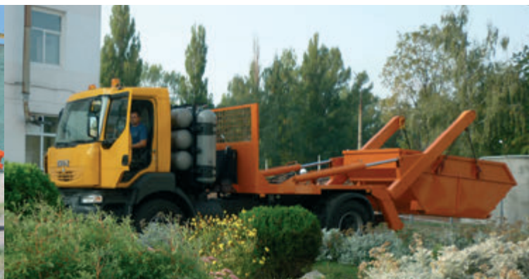
Портальний сміттєвоз КрАЗ-5401