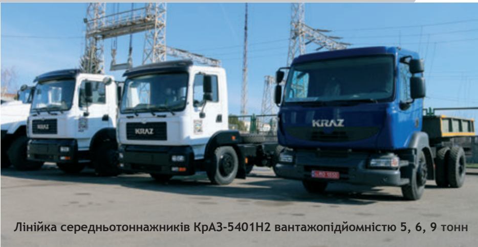
Лінійка середньотоннажників КраЗ-5401Н2 вантажопідйомністю 5, 6, 9 тонн