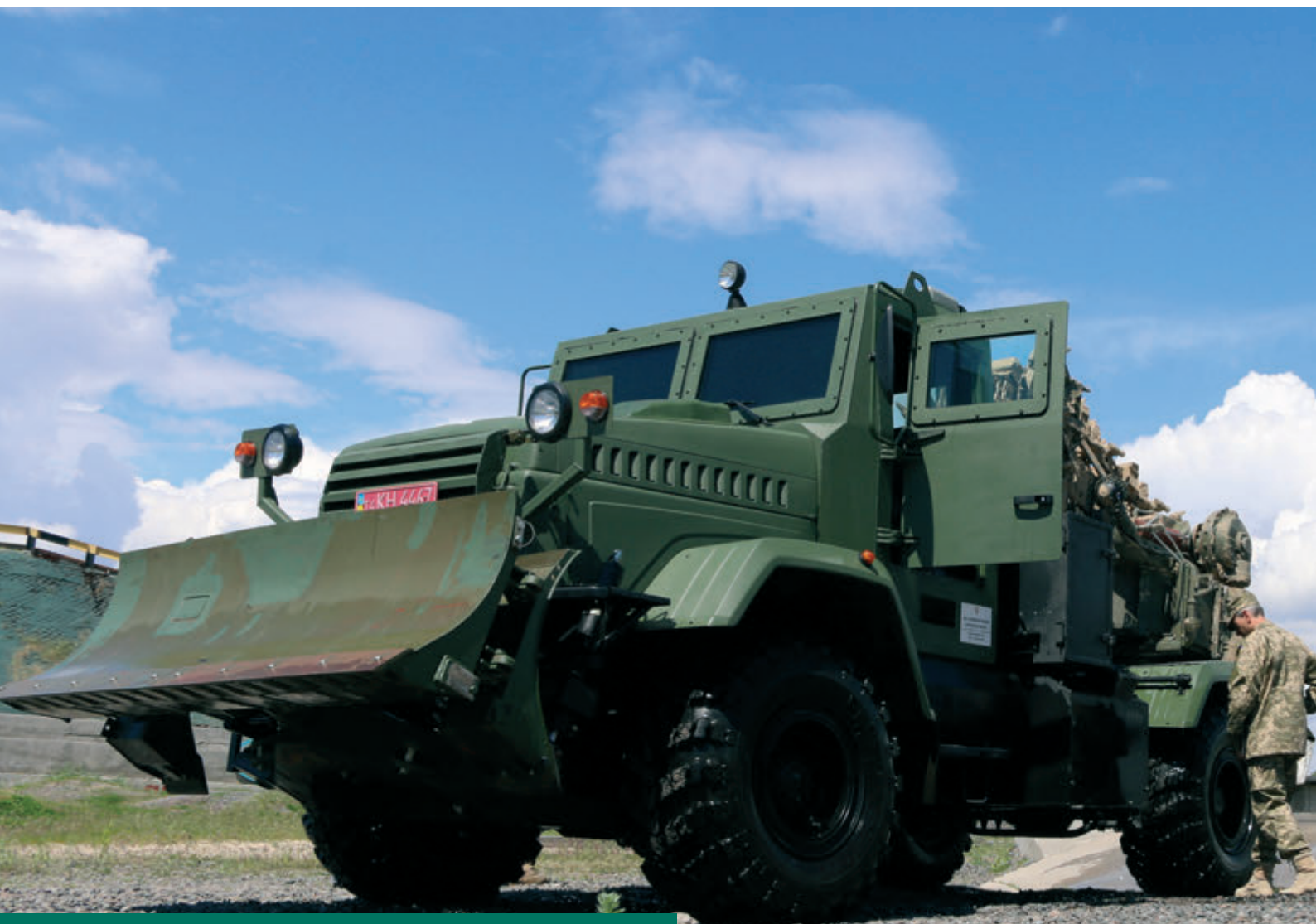
Броньований спецавтомобіль ПЗМ-3 на шасі КраЗ-5233НЕ

В основі інтересу до автомобілів КраЗ з боку військових — високі технічні та експлуатаційні характеристики українських всюдиходів. Вони мають все необхідне — потужність, міць, витривалість, надійність вузлів та агрегатів, простоту в експлуатації та обслуговуванні.