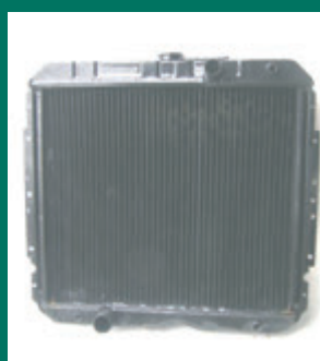
Радіатор УРАЛ -5323