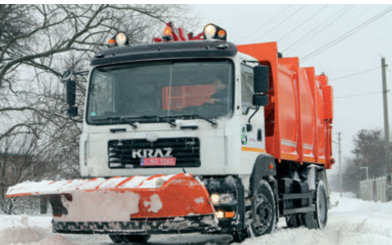
Сміттєвоз КрАЗ-5401 із боковим завантаженням та відвалом

Висока маневреність в межах міста — важлива характеристика для машини. Цьому сприяє не тільки зменшений розмір КрАЗ-5401, КрАЗ-4501, а й комфортабельна безкапотна кабіна. До слова, вона добре «прижилася» на всій лінійці машин для міста. Яка надбудова буде встановлена на