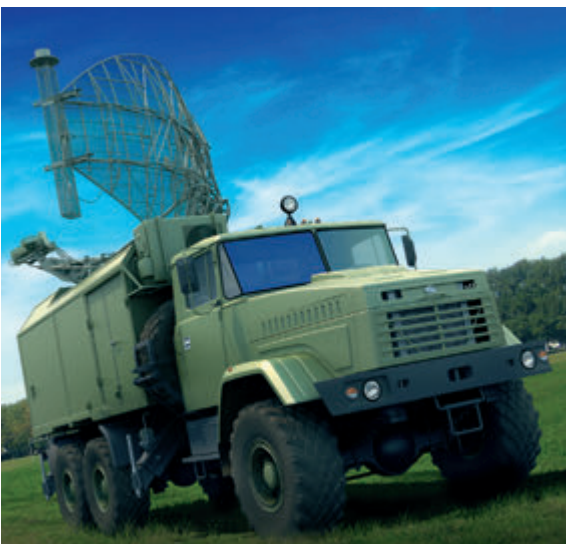
Мобільна радіолокаційна станція MARS-L