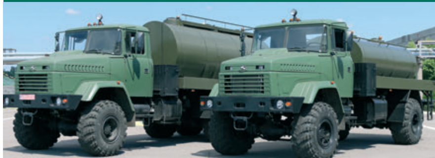
Автоцистерни «Джерело» для питної води 5 і 9 кубів на шасі всюдиходів КраЗ-5233ВЕ та КраЗ-6322