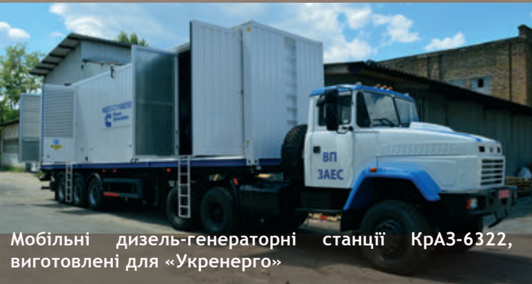
Мобільні дизель-генераторні станції КраЗ-6322, виготовлені для «Укренерго»