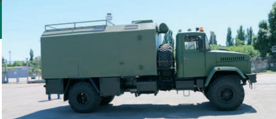
Броньований кузов-фургон на шасі КраЗ-5233НЕ

Останнім часом національний виробник - завод КраЗ, йде назустріч усім пропозиціям та побажанням військових, які для більш ефективного виконання поставлених завдань бачать серед свого оснащення різну спецтехніку. Підприємством враховано досвід застосування такої техніки в зоні військового конфлікту на сході країни, у тому числі використання базового шасі з компонуванням «кабіна за двигуном», що дозволить зберегти життя особового складу при непередбаченому наїзді на вибухові предмети. ПрАТ «Авто-КраЗ» й надалі розвиватиме військову лінійку спецтехніки КраЗ, аби прискорити відновлення миру в країні, полегшити українським військовим виконання ними своїх обов'язків та задля збереження людських життів.