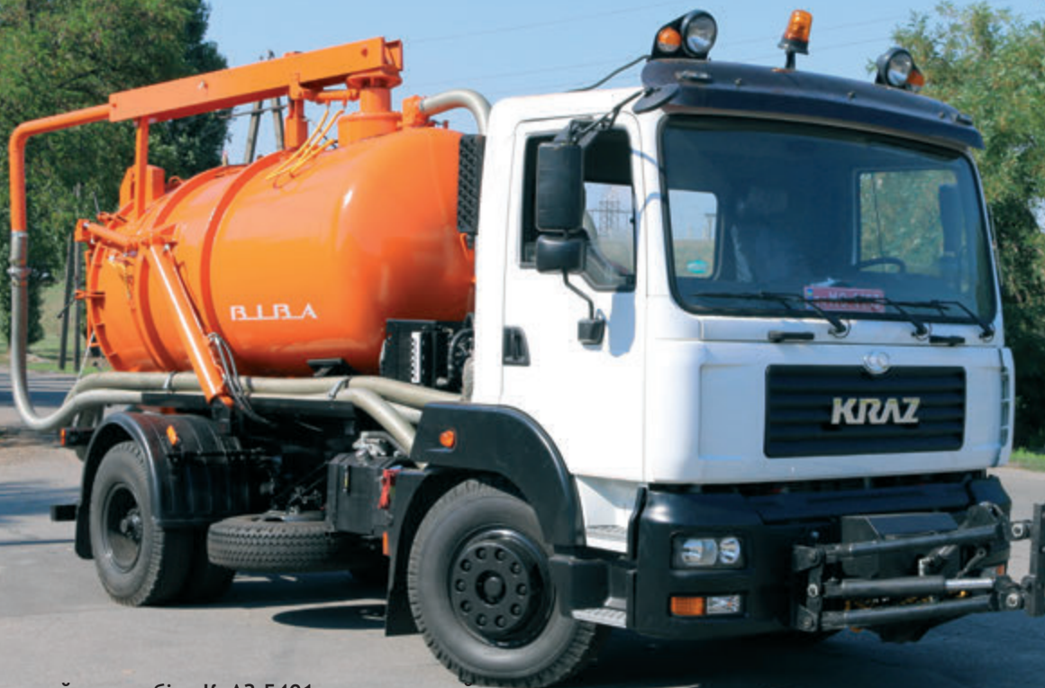
Мулососний автомобіль КрАЗ-5401, виготовлений для Горішніх Плавнів за кошти ПОДА.

Активність «КрАЗу» із заміни іноземних аналогів на внутрішньому ринку в сегменті мало- і середньотоннажної техніки — «на піку». Рекорди послідовного «схуднення» полегшених шасі КрАЗ-5401 (4x2 і 4x4) з 12, 10, 9 і до 6 тонн вантажопідйомності, не так давно побиті двовісним новачком КрАЗ-4501Н2, вантажопідйомністю 5 т. База найлегшого КрАЗу — 3250 мм, габаритна довжина — не більше 6230 мм. Відбір потужності — від коробки передач. Всі вузли та агрегати — полегшені. Рама — із гнучого профілю заввишки 260 мм, повітряні ресивери зменшеного обсягу, акумуляторні батареї зменшеної ємності (100 Ач), АБС. Колеса меншого типорозміру з шинами 9.00R20.