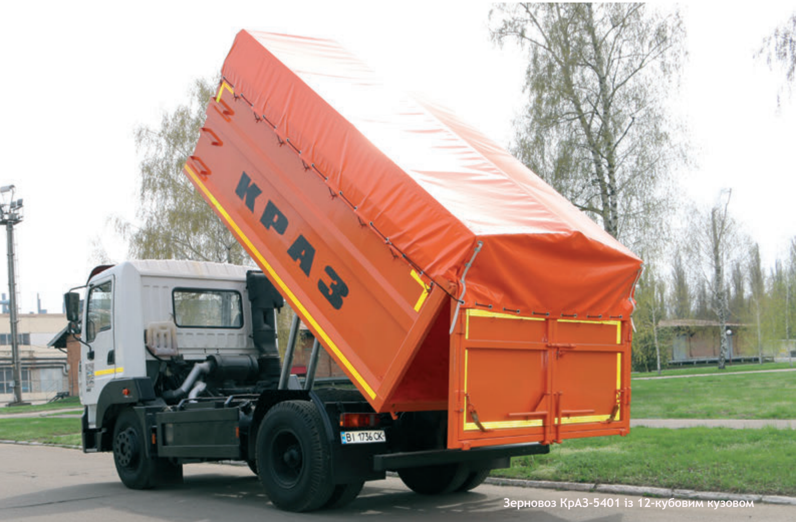
Зерновоз КрАЗ-5401 із 12-кубовим кузовом

До речі, стосовно контейнерів, то вони проектувалися для нового порталного сміттєвоза КрАЗ-5401, який займається вивозом виробничого та побутового сміття на ПрАТ «АвтоКрАЗ». Спецмашина представляє собою комунальний комплекс для збору сміття із системою скіп-ліфт. Сміттєвозне устаткування обладнане порталним навантажувачем для транспортування негабаритних і будівельних відходів, контейнером ковшового типу об'ємом 10 кубометрів. Портальний навантажувач піднімає контейнер горизонтально, із легкістю переносить його через перешкоду. Один автомобіль обслуговує десятки контейнерів, розміщених по всьому заводі.