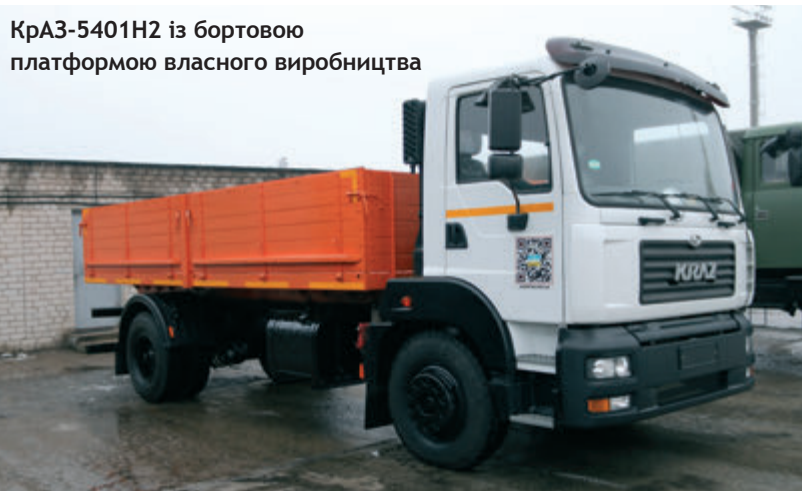
КрАЗ-5401Н2 із бортовою платформою власного виробництва