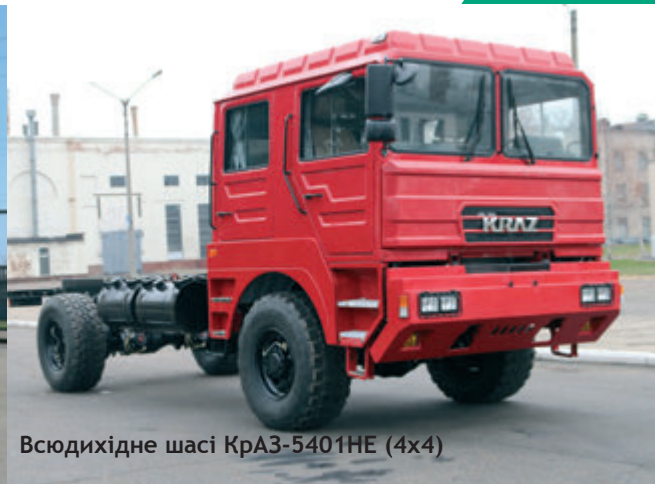
Всюдихідне шасі КраЗ-5401НЕ (4x4)