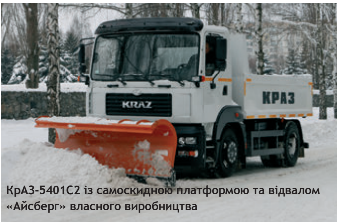
КрАЗ-5401С2 із самоскидною платформою та відвалом «Айсберг» власного виробництва

А там, дивись, досвід Кременчуцького автозаводу піде у масу, бо чистота в українських містах і селах – то вже стало трендом, у душі часу.