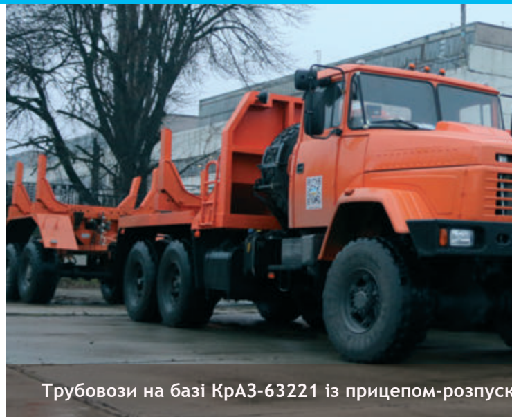
Трубовози на базі КрАЗ-63221 із прицепом-розпуск

Перемога в тендерах, також, – черговий крок для закріплення позицій «КрАЗу» на внутрішньому ринку. Із введенням системи «Прозорро» значно легше стало працювати нв Україні: практично відкриті торги. Якщо тендер прописаний під якусь іномарку, то учасникам одразу видно. Коли прозорі, відкриті та чесні тендери, як, наприклад, в «Укргазвидобування», там «КрАЗ» – переможець. «АвтоКрАЗ» та найбільшого оператора газотранспортної системи України ПАТ «Укргазвидобування» пов'язують давні та тісні партнерські відносини. 2017 рік став рекордним за останні 10 років за кількістю відвантаженої техніки та різновидом моделей. До філій «Укргазвидобування» надійшло близько 200 одиниць нової техніки КрАЗ та спецвиробів на його базі, серед яких тягачі, автокрани, автоцистерни, самоскиди, лабораторії, трубовози. В основному, це повнопривідні вантажівки, які найбільше підходять для роботи в умовах віддаленої місцевості.