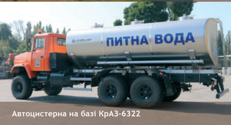
Автоцистерна на базі КраЗ-6322