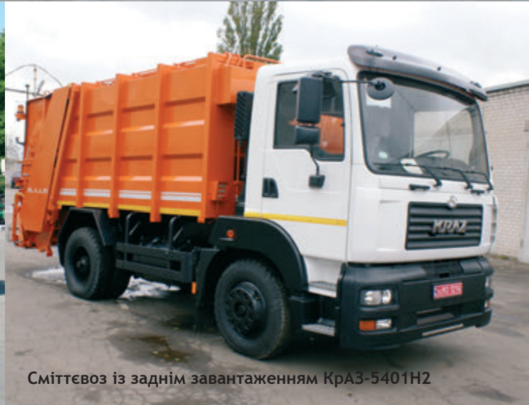
Сміттєвоз із заднім завантаженням КраЗ-5401Н2

«малюків» — диктує замовник. Уже по всій Україні працюють КраЗи зі сміттєвозним, снігоприбиральним, поливомийним, мулососним, вакуумним обладнанням. А ось в будівельній галузі це шасі поки так активно не задіяне. Проте після закінчення конфлікту на сході країни знадобиться багато різної будівельної техніки для відродження зруйнованих війною міст і сіл. Ось тут-то КраЗу не буде рівних для монтажу на його базі кранів, бетонозмішувачів, бетононасосів, екскаваторів та іншого будівельного обладнання. Яка б спецнадбудова не була змонтована на будь-якому з представлених в лінійці шасі класу міні, можна бути твердо впевненим у тому, що спецтехніці під силу виконання різних завдань. А покупець знайде надійного і ефективного помічника на довгі роки. Серед клієнтів ПрАТ «АвтоКраЗ» — комунальні підприємства міст та об'єднання територіальних громад України. Географія продажів автотехніки «КраЗ» розширюється. Так, у 2017 році Кременчуцький автозавод продав цивільної техніки на внутрішньому ринку втричі більше, ніж роком раніше. В основному, великий попит на універсальну спецтехніку, яка використовується цілорічно із замінним спецобладнанням, у залежності від сезону. Наразі є всі передумови для збільшення кількості реалізованої на ринку