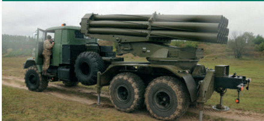
Реактивна система залпового вогню КраЗ-6322 «Ураган»