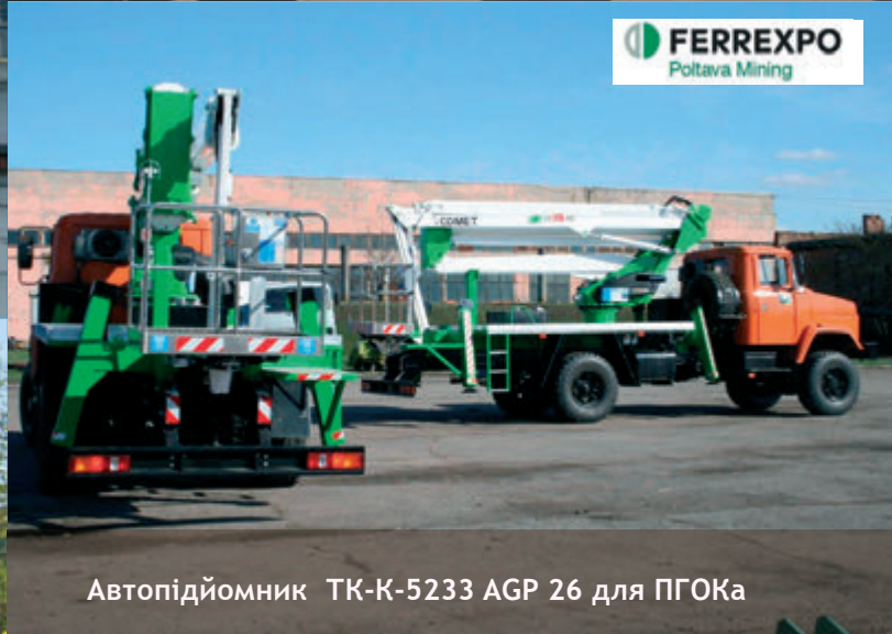
Автопідйомник ТК-К-5233 АGR 26 для ПГОКа