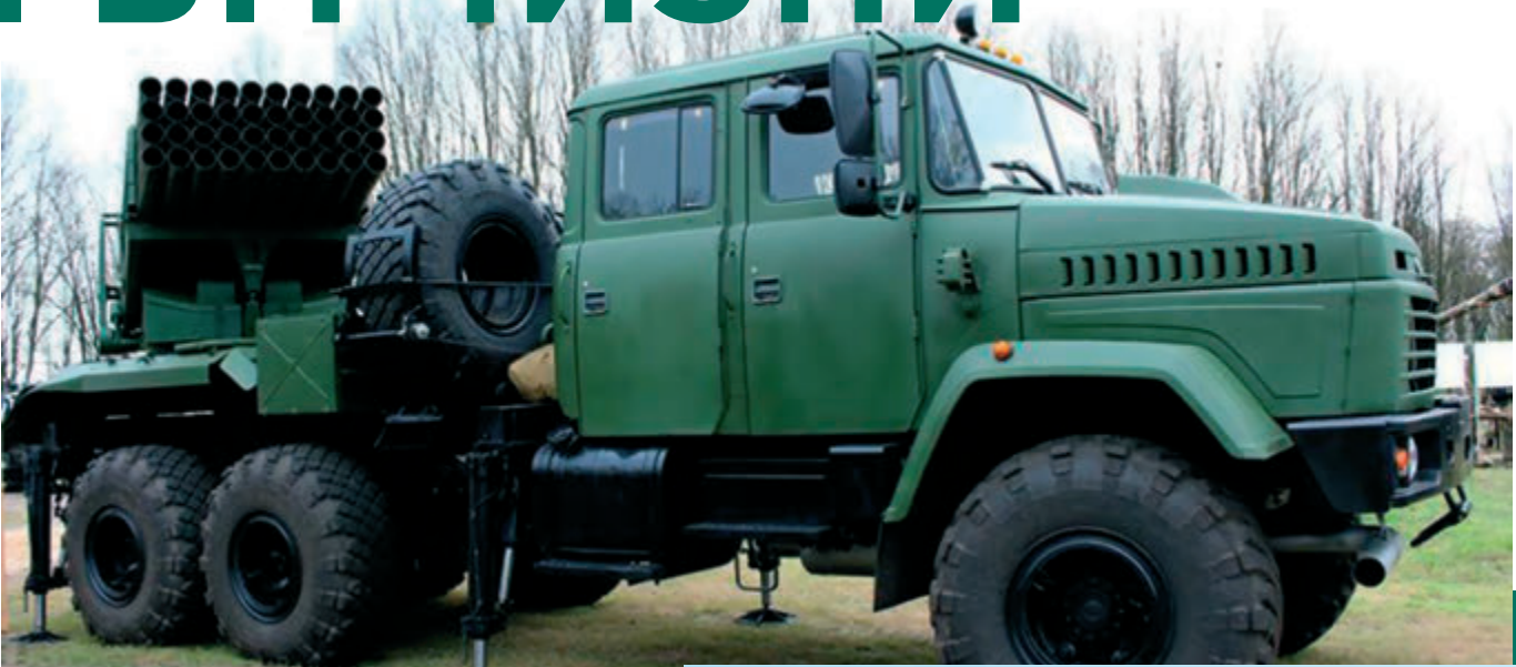
КраЗ-6322 «Верба», реактивна система залпового вогню

Останнім часом національний виробник - завод КраЗ, йде назустріч усім пропозиціям та побажанням військових, які для більш ефективного виконання поставлених завдань бачать серед свого оснащення різну спецтехніку. Підприємством враховано досвід застосування такої техніки в зоні військового конфлікту на сході країни, у тому числі використання базового шасі з компонуванням «кабіна за двигуном», що дозволить зберегти життя особового складу при непередбаченому наїзді на вибухові предмети. ПрАТ «Авто-КраЗ» й надалі розвиватиме військову лінійку спецтехніки КраЗ, аби прискорити відновлення миру в країні, полегшити українським військовим виконання ними своїх обов'язків та задля збереження людських життів.