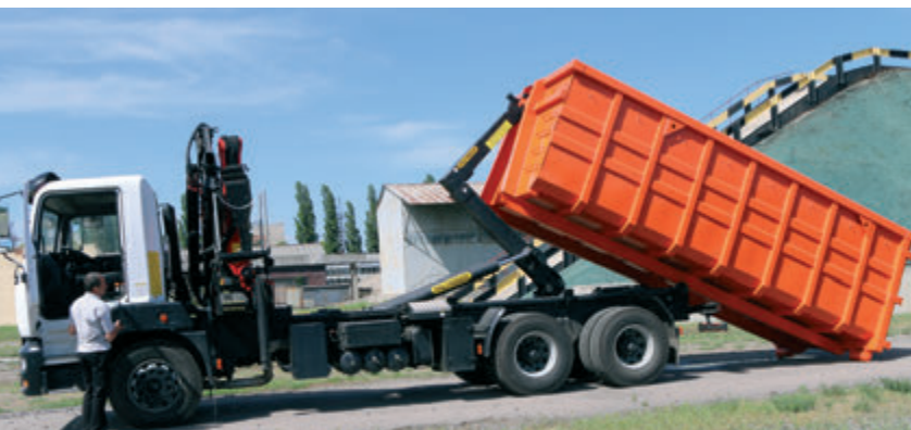
Сміттєвоз КрАЗ-6511Н4 із змінним контейнером та мультіліфтовою системою

Вже зараз, менш ніж за два роки від прийняття рішення із освоєння на виробничих потужностях нового виду продукції, технологами «КрАЗу» спроектовано і виготовлено 7- та 12-кубові самоскидні кузова на зерновоз та самоскид КрАЗ-5401С2, бортову платформу на новенький автомобіль КрАЗ-5401Н2, платформу із суцільнометалевими бортами на автомобіль КрАЗ-65053 із семимісною кабіною, оригінальну платформу на автомобіль КрАЗ-5233 з односекційними металевими бортами, що відкриваються незалежно один від одного, дві моделі снігоприбиральних відвалів «Айсберг», контейнери для збирання крупногабаритного сміття.