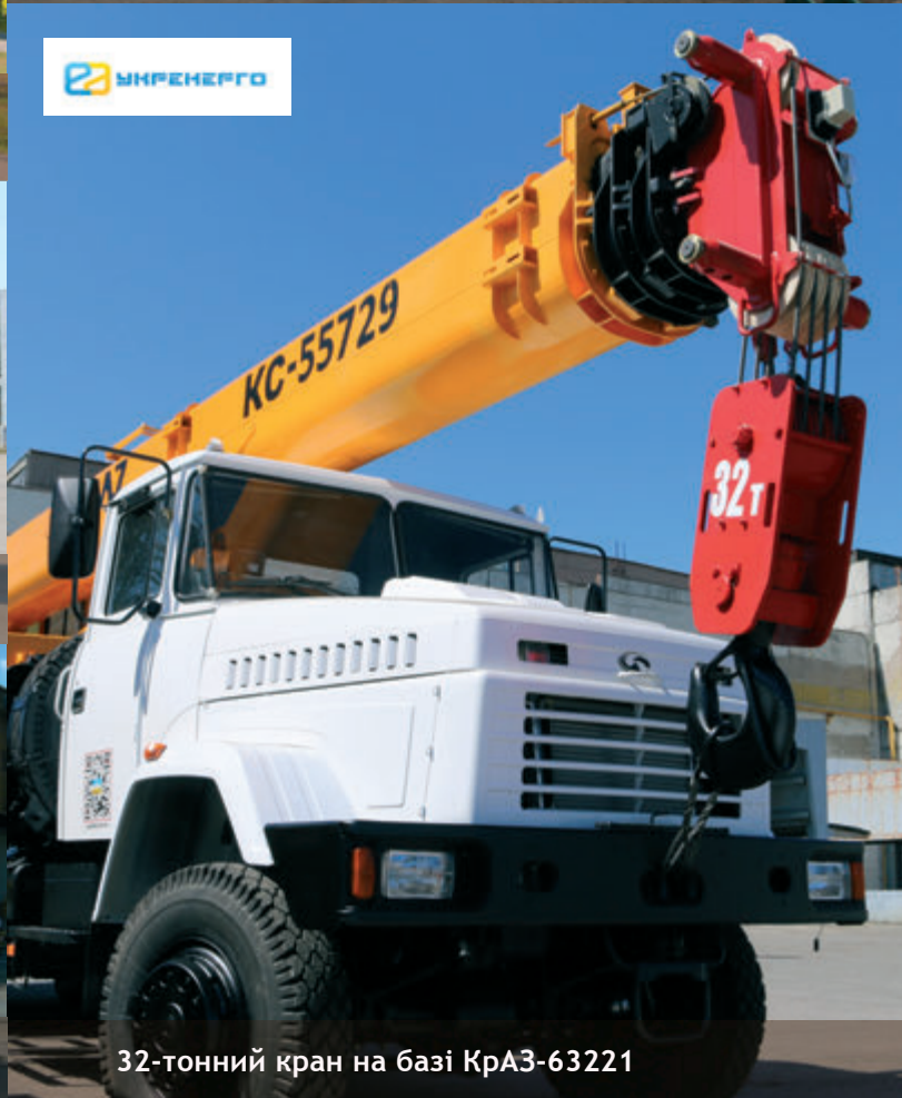
32-тонний кран на базі КраЗ-63221