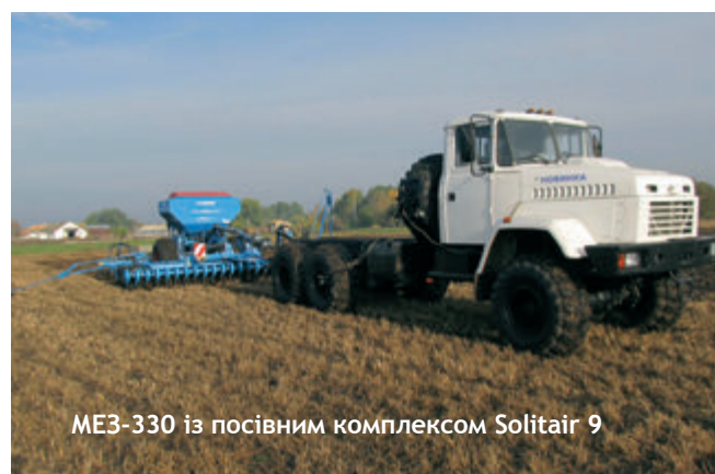
МЕЗ-330 із посівним комплексом Solitair 9